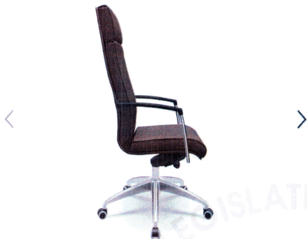
Item 1 - Cadeira estofada presidente em corino com braço